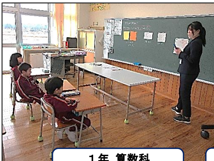
1年 算数科 どちらがひろい？

今年度最後の学習参観では、それぞれの学級で、自分の成長や頑張っていること、今後の生活で大切にしたい言葉などを紹介したり、1年間練習を続けてきた歌や器楽合奏を発表したりしました。また、家族や友達と一緒に問題の解き方を考えたり、自分の考えを友達に説明したりする学級もありました。保護者の皆さんも子供たちの様子を、微笑みながら見守ってくださり、どの学級もあたたかな雰囲気でした。今年度は「自分の考えをもち、表現する」ことに力を入れて取り組んでいます。学級での話し合い活動だけでなく、ランチタイムの放送等、表現の場を工夫していますが、学習参観も子供たちの表現力を伸ばすよい機会となりました。