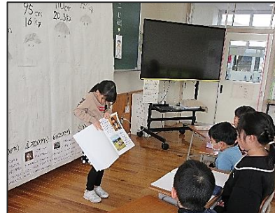
2年 生活科 ぐんぐん大きくなったよ ～自分たんけん～