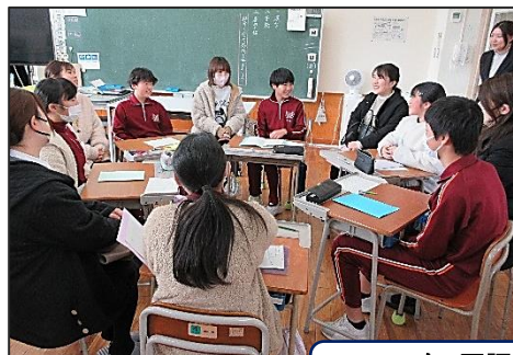
6年 国語科 大切にしたい言葉