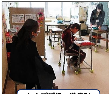
たんぼぼ級 道徳科 がんばっているよ