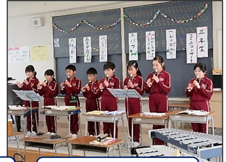
3年 音楽科 3年生 ミニコンサート