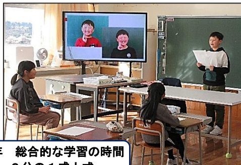
4年 総合的な学習の時間 2分の1成人式