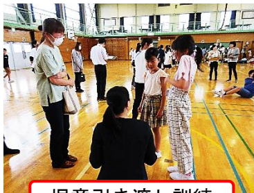
児童引き渡し訓練

災害や不審者、熊の出没等に備えて、児童引き渡し訓練を行いました。引き渡しの手順は、登校班ごとに待機している児童のところへ迎えに来ていただき、担当の教員に児童との関係を伝えます。教員は、児童に間違いがないか確認した上で、児童を引き渡すというものです。多数の方にご参加いただき、スムーズに訓練を実施することができました。ありがとうございました。