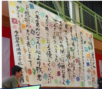
3年生 感謝状贈呈 書道パフォーマンスのような大きな紙に、毛筆で丁寧に書きました。とても迫力があります。