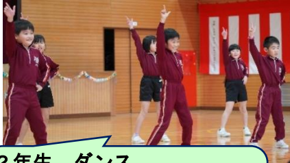
2年生 ダンス 「アンダー・ザ・シー」「友よ〜この先もずっと…」の2曲を元気に踊りました。