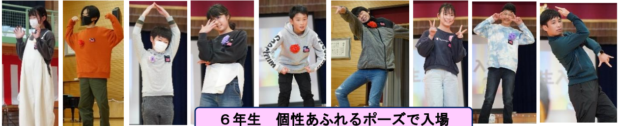
6年生 個性あふれるポーズで入場

体育館に全校児童が集まり、6年生へ、各学年児童の工夫を凝らした出し物やプレゼントで、お祝いと感謝の気持ちを伝えました。とても心温まる会になりました。