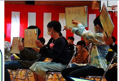
5年生 そろよねゲーム 今年の思い出といえば、運動会や宿泊学習と答えている6年生が多くいました。