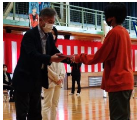
卒業祝い品贈呈 6年生へ、後援会から「卒業証書ホルダー」、PTAから「オリジナルマグカップ」をいただきました。