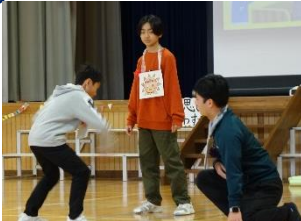
6年生から在校生へのお返し 器楽合奏や劇などを披露してくれました。「サンサンちゃん」や「としょりん」が登場する楽しい劇に、笑いが巻き起こりました。