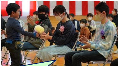
1年生 プレゼント 1年生が育てたアサガオの種と花束、歌のプレゼントをしました。