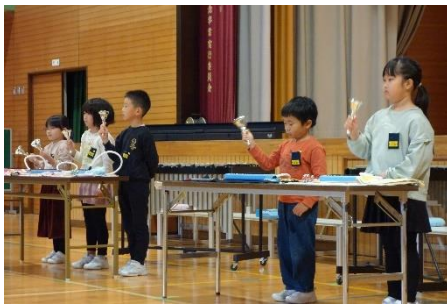
1年 音楽科 そらがはれたら

また今回は、親子活動として「森の寺子屋」を開催しました。フォレストリーダーさんを講師に「森林のはたらき」の講演や木の実を貼り付けたフォトフレーム作りをしました。親子で相談しながら、アイディアあふれる個性的な作品ができました。完成したフレームに、学校や家庭での楽しい思い出の写真が飾られることを期待しています。