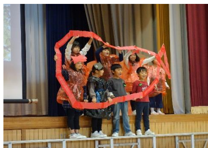
2年 国語科 スイミー