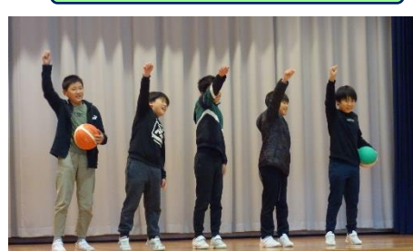
5年 外国科 Our School Life