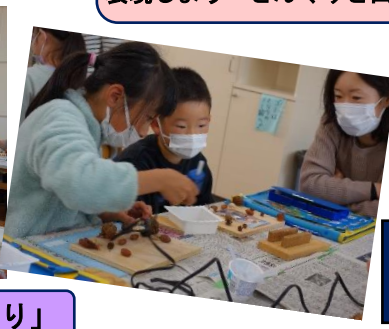
親子活動 「フォトフレーム作り」