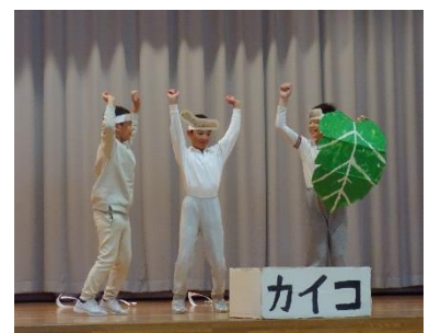
3年 理科 カイコ物語