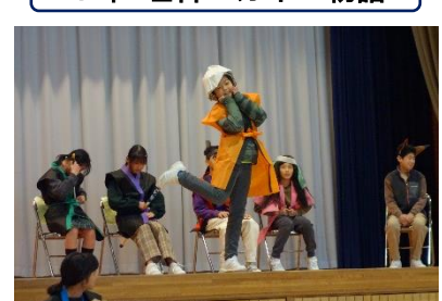
6年 国語科・社会科 宮沢賢治の童話を歴史上の人物で 表現しよう「どんぐりと山猫」