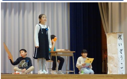
4年 総合的な学習の時間 地球温暖化を防ごう!! ～今わたしたちにできること～