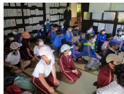
【おおかみこどもの花の家】