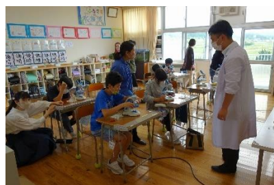
【6年 生物のくらしと環境】

学習参観後は、「ねむりのパワーを見つけ出そう!」というテーマで、学校保健委員会を開催しました。本校の実態として、メディアの長時間の使用や習い事等で就寝時刻が遅くなっている子供や、朝や授業中にあくびをしている子供が見られます。そこで、子供たちが睡眠の大切さを理解し、家族とともに睡眠時間の確保について考えてもらう機会となることを期待し、このテーマを設定しました。