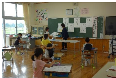
【3年 俳句を楽しもう】

今年度2回目の学校公開を行いました。まずは学習参観です。1・2年生は算数科、3年生は国語科、4・5・6年生は理科、たんぽぽ級は総合的な学習の時間を公開し、たくさんの方に参観していただきました。下の写真は、その一部の様子です。