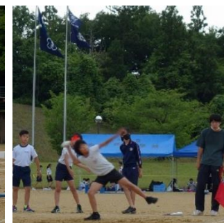
【ジャベリックボール投げ】