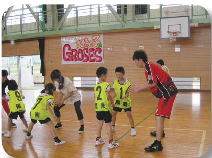
親子で楽しむスポーツ教室 「富山グラウジーズの選手たちと」