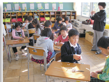
白萩西部小学校との 交流活動（2年生）