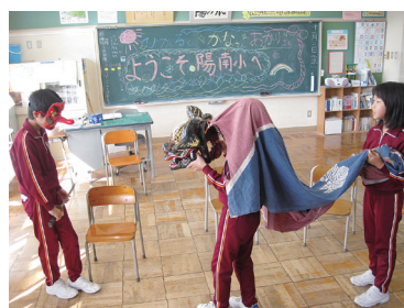
魚津市立坪野小学校との 交流活動（5年生）