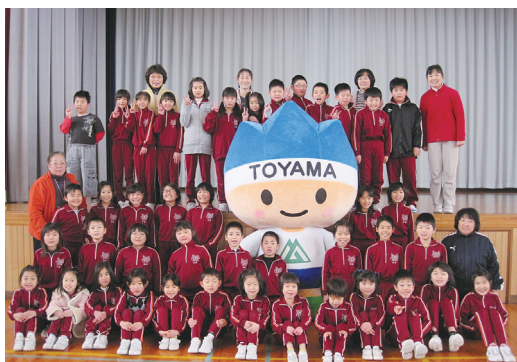
とやま元気っ子育成事業