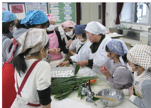
伝統に学ぶクラブ「笹だんごづくり」