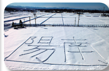
雪のグラウンドに 「陽南」の文字