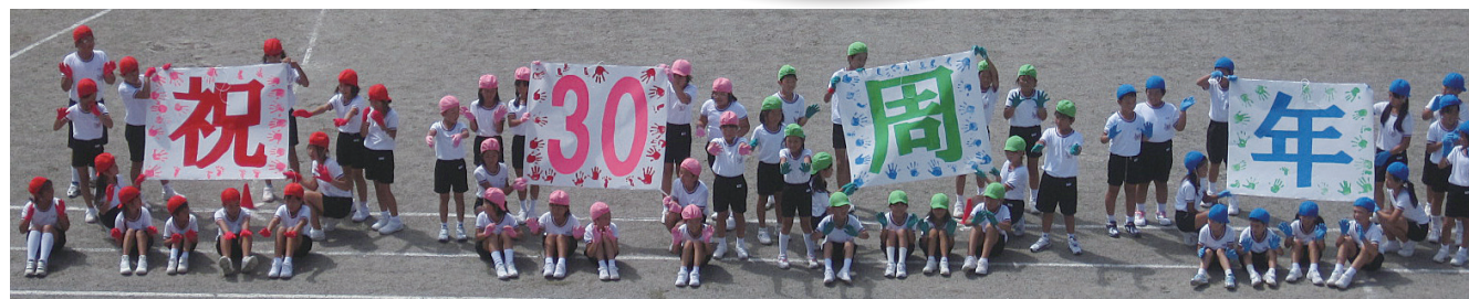
記念校区秋季大運動会～全校児童による演技～