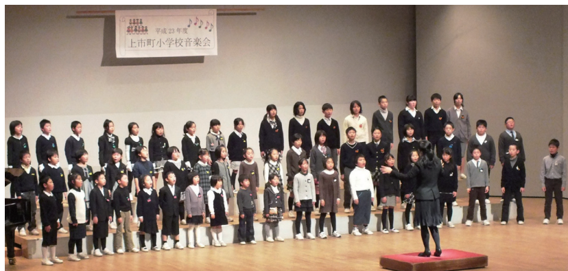
町小学校音楽会 ーカリヨンの鐘から流れるメロディを歌おうー