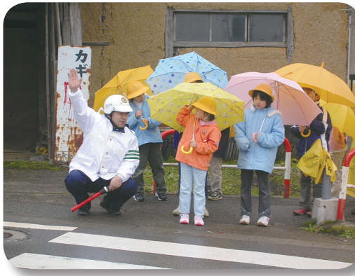
新1年生を迎えて 1～3年生交通安全教室

食育の大きな柱となる「調理」に全校児童が取り組み、「陽南 食べまくり食祭」と題して、保護者や地域の方、保育所児を招いて共に調理を楽しんだ。