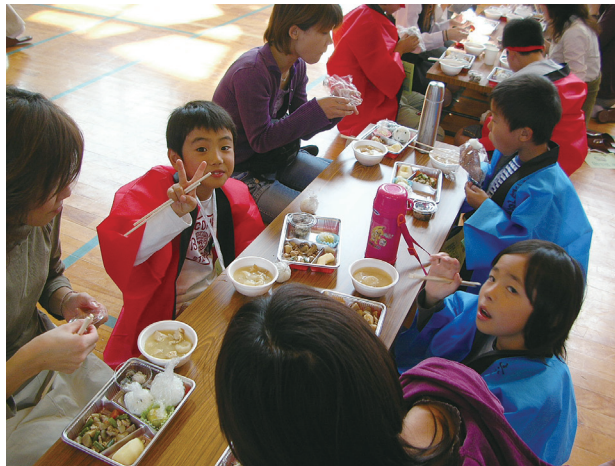
「陽南 食べまくり 食祭」