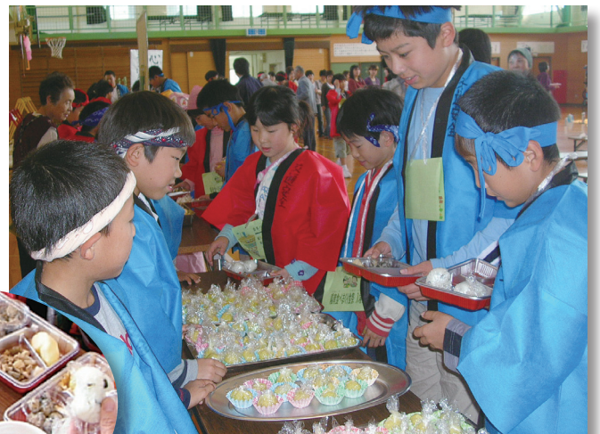
はっぴを着て、売りに挑戦！ 自分たちの手作り料理をアピール