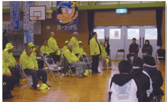
児童安全パトロール隊設立式