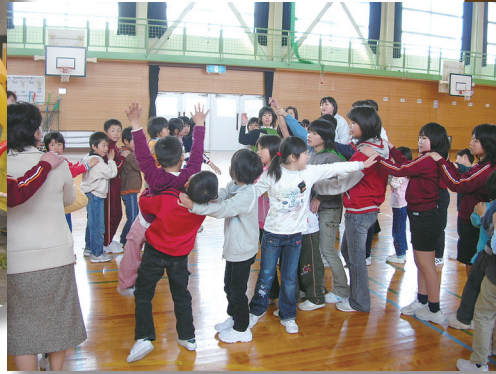
1年生歓迎集会 元気な陽南っ子の仲間入り