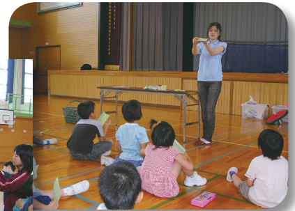
1・2年生科学実験教室 よく飛ぶ飛行機作りに挑戦