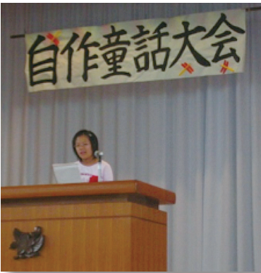
中新川郡自作童話大会